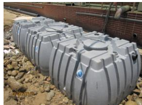
奈米抗菌雨水回收槽