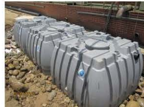
奈米抗菌雨水回收槽